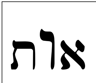
Zeichen (hebr. OT)

Die hebräische Sprache hilft uns, dieses Geschehen von JJ22.23,24 besser zu verstehen, wenn wir das Wort "Zeichen" auf die folgende Weise darstellen: